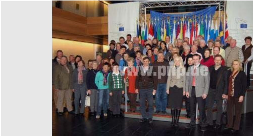
Die Teilnehmergruppe mit Europaabgeordnetem Manfred Weber (vorne, dritter von rechts) vor den Fahnen der EU-Nationen im Europaparlament.

Dichtes Programm bei der Informationsfahrt zum niederbayerischen Europaabgeordneten Manfred Weber