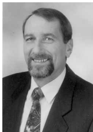
Augustin Wittenzellner Bürgermeister in Kollnburg von 1990 bis 2008