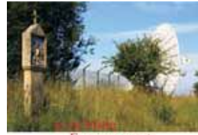
Europas gerückt Ein Lesebuch über die Zukunft des Bayerischen Waldes

Die Gemeinde Kollnburg und der lichtung verlag aus Viechtach (in Zusammenarbeit mit dem Bayerwaldforum e.V.) laden zur Buchvorstellung von „In die Mitte Europas gerückt“, ein Lesebuch über die Zukunft des Bayerischen Waldes, mit Herausgeber Hubert Ettl am Donnerstag,