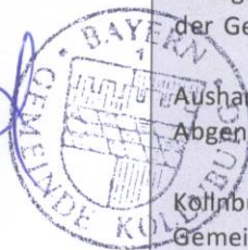
Josefa Schmid Erste Bürgermeisterin

Ortsüblich bekannt gemacht durch Aushang im Bekanntmachungskasten beim Rathaus Kollnburg und auf der Homepage der Gemeinde Kollnburg ( www.kollnburg.de )