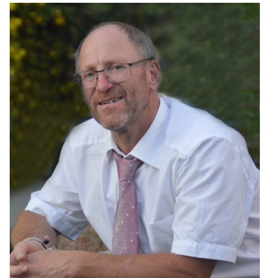
Herbert Preuß Erster Bürgermeister