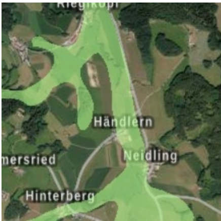
Abbildung 1: Wassersensibler Bereich in der Umgebung des Vorhabens (Quelle: BayernAtlas 2021).

Der Geltungsbereich liegt wohl randlich im oder knapp außerhalb des wassersensiblen Bereiches des angrenzenden Gewässers (siehe nachfolgende Abbildung). Die genauen Hochwassergefahrenflächen (z.B. HQ 100 ) sind für die Aitnach nicht amtlich ermittelt.