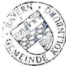
Herbert Preuß Erster Bürgermeister

Kollnburg, den 25.07.2022 Gemeinde Kollnburg