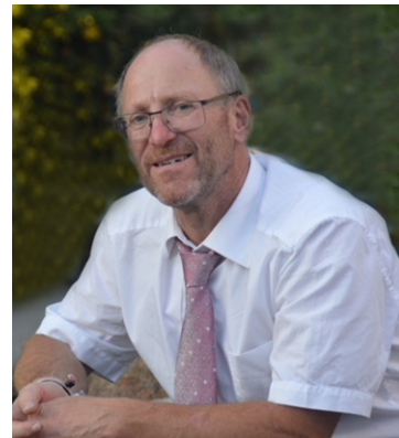
Herbert Preuß Erster Bürgermeister