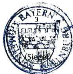
Herbert Preuß Erster Bürgermeister

Veröffentlicht am 06.06.2024; zusätzlich im Internet unter www.kollnburg.de/aktuelles